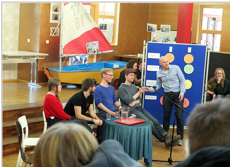
Podiumsdiskussion mit Ehemaligen zum Schulgeburtstag im Februar 2018

Hier der Ablauf zum Schulgeburtstag am Mittwoch den 27. Februar 2019: